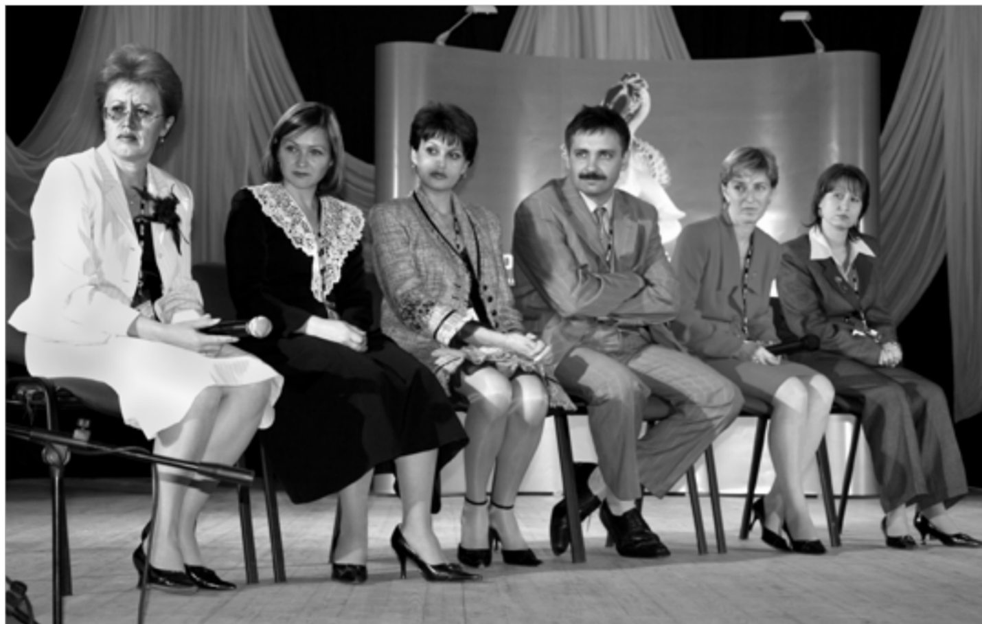
Участники конкурса «Учитель года России-2005»

В психологии принято считать, что осознание многих проблем происходит только тогда, когда человек встречается с трудностями, проблемными ситуациями. К этому можно добавить, что сами проблемы, трудности, противоречия появляются только тогда, когда человек действует. Пока мы сидим и замысловато философствуем о педагогической деятельности, реальные проблемы малозаметны, чаще они являются умозрительными и даже псевдопроблемами. Поэтому во время конкурса происходит процесс взаимообогащения, расширения собственного опыта, обмен передовыми