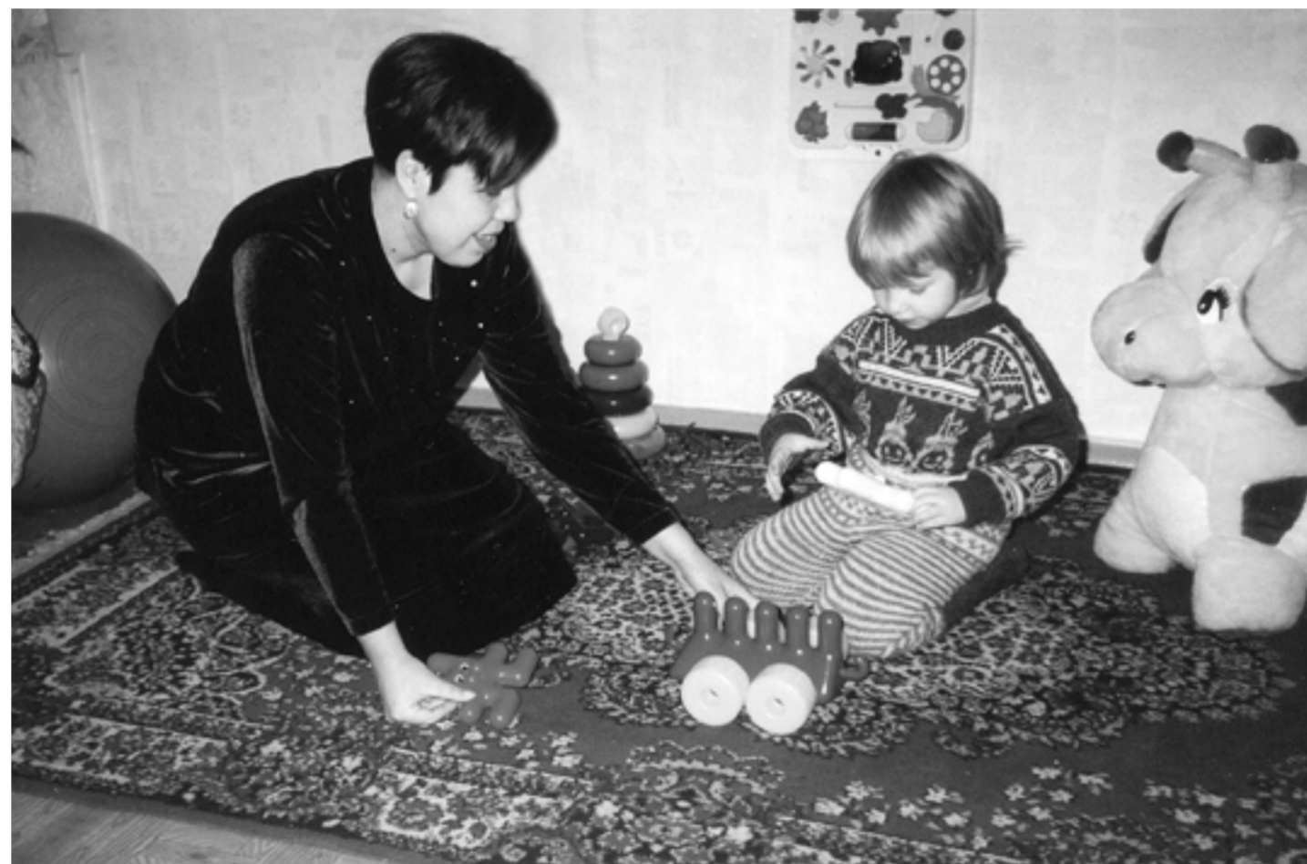
Учитель-логопед проводит диагностику трехлетнего ребенка в игровой форме

Другая проблема связана с тем, что сегодня ни в Челябинской области, ни в Уральском регионе, ни в России нет единого пакета стан-